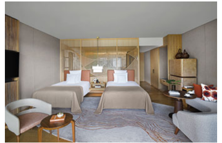
クラシックツイン (*マウンテンビュー)