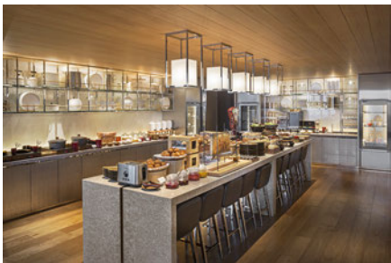
地元の新鮮な食材を使った前菜・パン・デザート が並ぶbuffetボード