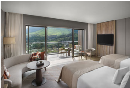
クラシックツイン シティビュー

現代の快適さと和の伝統が共存するお部屋。 石や竹などの天然素材が随所に使われた空間は、洗練されたスタイルと落ち着いたむくもりに満ちている。