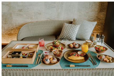
卵料理を中心に和・洋スタイルの朝食ご用意