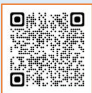
ANA 空港アクセスナビ