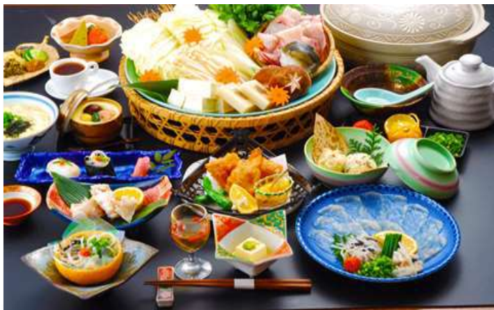
料理写真はイメージ