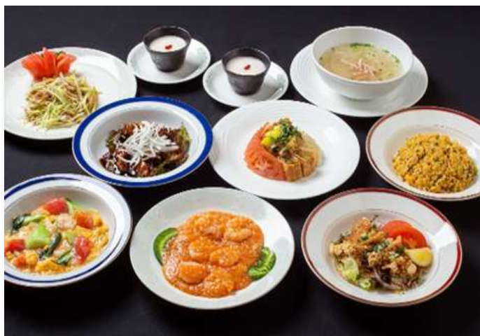
料理写真はイメージ