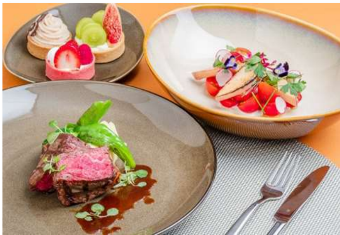
料理写真はイメージ（ホテル提供）